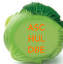
3. Teil eines Möbelstücks