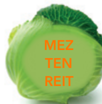
1. Eine Maßeinheit

Ganz einfach oder doch schwierig? Finden Sie das Wort, das wir in jedem Salatkopf versteckt haben.