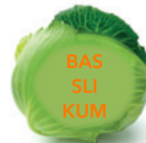
4. Kein Gewürz