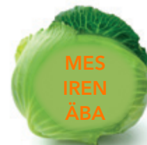
2. Ein Tier